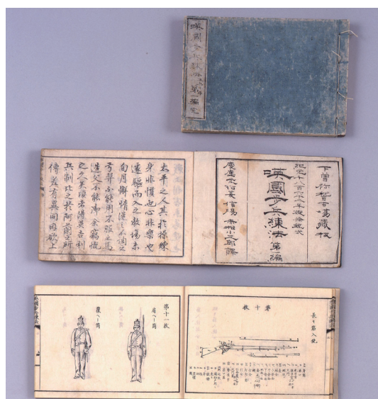
英国歩兵練法（青本）の一部 上田市立博物館蔵