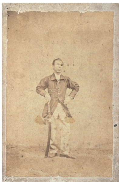
赤松小三郎立像写真 上田市立博物館蔵